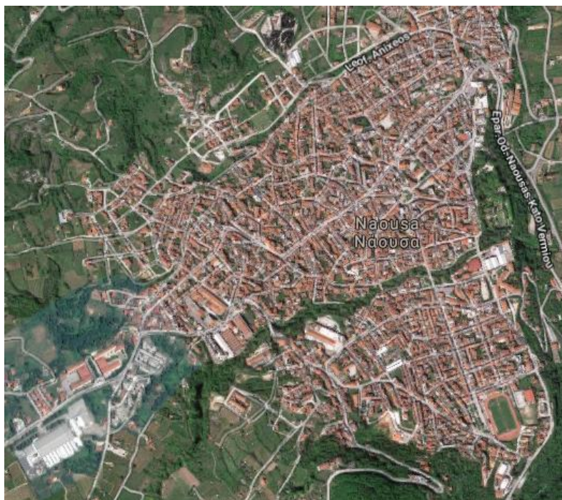
Εικόνα 1 Η πόλη της Νάουσας από το Google maps

Η παρούσα μελέτη αφορά τον προμήθεια δύο μικρών ηλεκτροκίνητων αυτοκινήτων και αντίστοιχους σταθμούς φόρτισης από το Δήμο της Ηρωικής πόλης της Νάουσας.